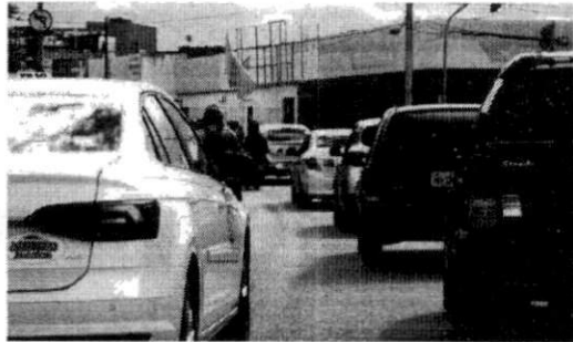
OS PAGAMENTOS DEVEM SER FEITOS PELO SITE DO DETRAN/MA OU EM UMA CIRETRAN

Mas atenção: a dívida só vai ser extinta caso a moto seja de até 150 cilindradas e custe até R$ 10 mil. E também só vale para dívidas até 2020. De