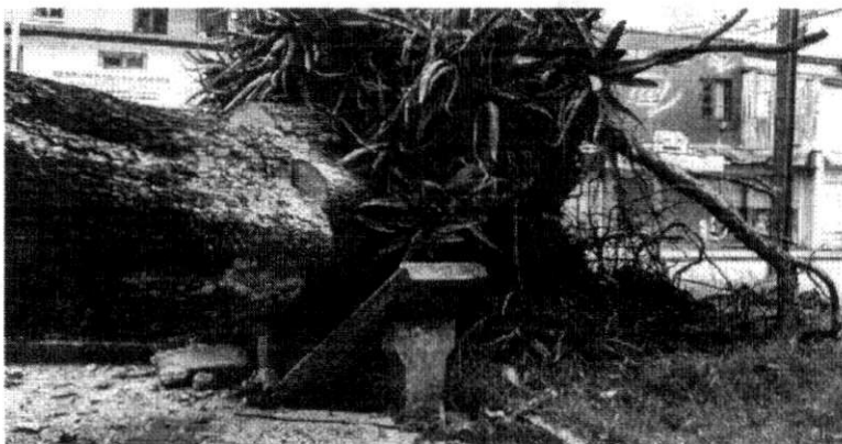
CERCA DE 55 MIL PESSOAS TIVERAM QUE DEIXAR AS CASAS ONDE MORAM POR CAUSA DA PASSAGEM DO CICLONE

Antananarivo, Madagascar - O ciclone Batsirai saiu de Madagascar na manhã desta segunda-feira (7/2) sem afetar as principais cidades, mas deixou pelo menos 20 mortos e devastou arrozais no centro do país, o que pode agravar a situação humanitária.