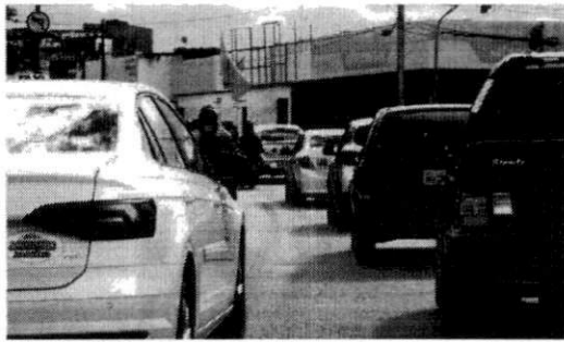
OS PAGAMENTOS DEVEM SER FEITOS PELO SITE DO DETRAN/MA OU EM UMA CIRETRAN

Mas atenção: a dívida só vai ser extinta caso a moto seja de até 150 cilindradas e custe até R$ 10 mil. E também só vale para dívidas até 2020. De