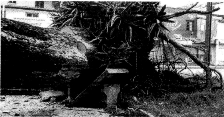
CERCA DE 55 MIL PESSOAS TIVERAM QUE DEIXAR AS CASAS ONDE MORAM POR CAUSA DA PASSAGEM DO CICLONE

Antananarivo, Madagascar – O ciclone Batsirai saiu de Madagascar na manhã desta segunda-feira (7/2) sem afetar as principais cidades, mas deixou pelo menos 20 mortos e devastou arrozais no centro do país, o que pode agravar a situação humanitária.