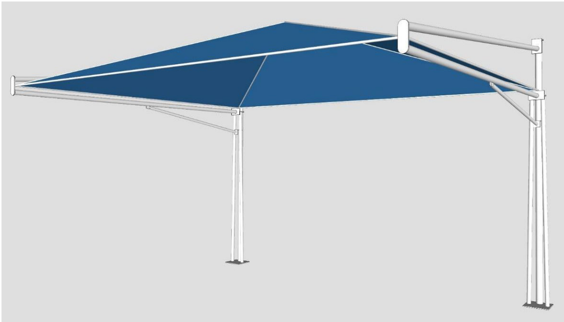
Figura 01: Exemplo da especificação da cobertura solicitada, podendo haver variações para melhor atender ao propósito da solicitação.

6.1.6. O item remunera fornecimento e instalação de cobertura sombreadora em lona PVC impermeável, o modelo está detalhado em anexo a este memorial.